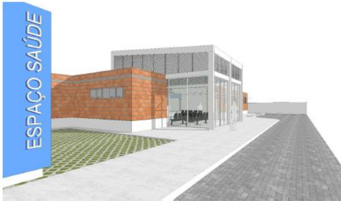
figura02 – Perspectiva