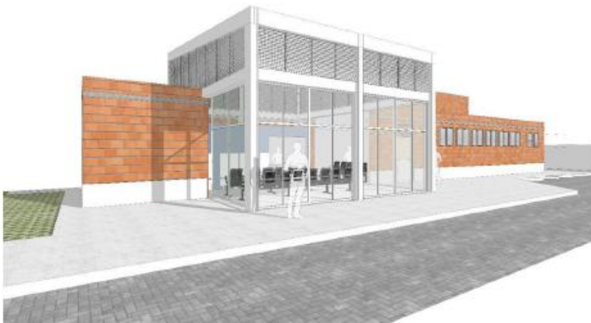
figura04 – Perspectiva