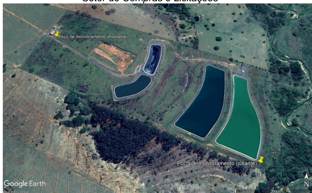
Figura 1. Localização poços de monitoramento na ETE-Sul.